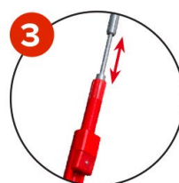
3 Glissière intégrée pour éviter la casse