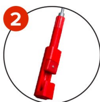
2 Facile à fixer à n'importe quel filet