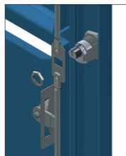
4 Serrer l'écrou