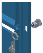
2 Mettre la serrure en place