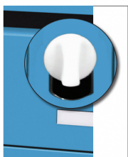
1 Retirer la vis plastique et la tringle

Pour un immeuble existant, il suffit de récupérer la serrure normalisée installée sur le bloc précédent.