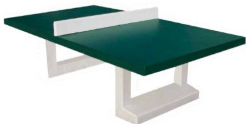
TABLE DE PING PONG EN BÉTON Référence : 04143