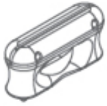
Système articulé en caoutchouc noir