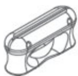
Système articulé en caoutchouc noir