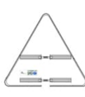
PVC sans pied avec rails