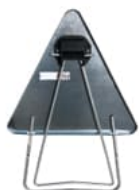
Acier sur pied dépendant