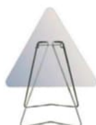
PVC sur pied indépendant