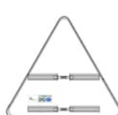
PVC sans pied avec rails