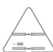
PVC sans pied avec rails